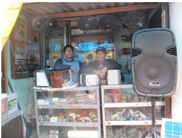
Servicio Electrónica Huancavelica