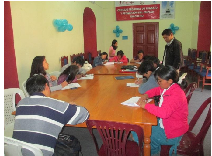
Reunión grupal Ayacucho