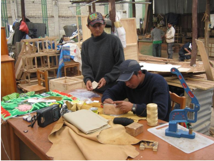
Producción billeteras de cuero Penal Huancavelica