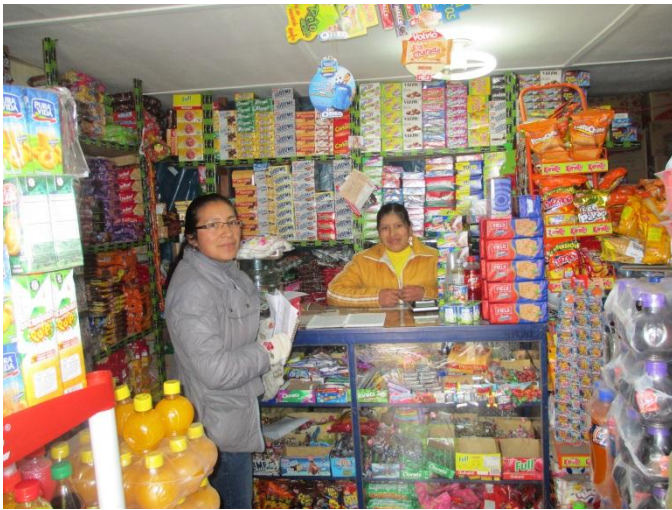
Venta de golosinas - Huancavelica